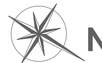
Plan de pré-commercialisation